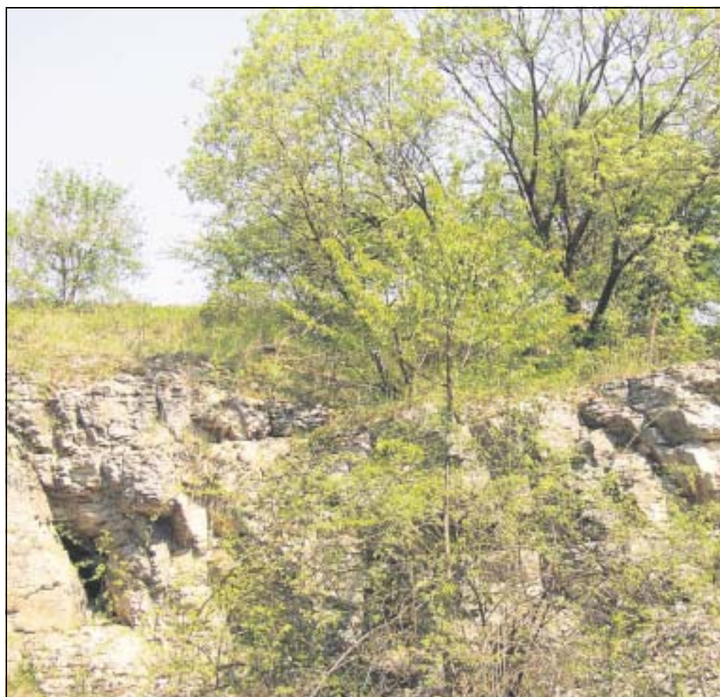
Steinbrüche können als Lebensräume aus zweiter Hand ökologisch reichhaltige Inseln inmitten unserer vielerorts verarmten Kulturlandschaft werden.