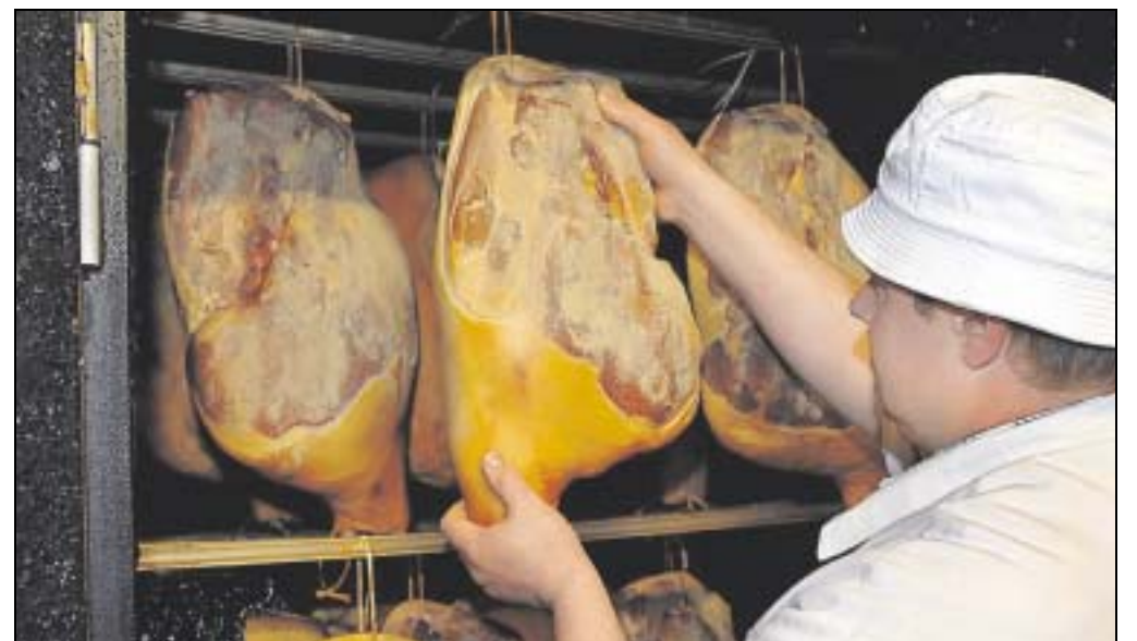
In Buchenholz wird der Knochenschinken geräuchert, um anschließend sechs Monate zu reifen.

Der Knochenschinken in Arbeit: Damit er so lecker schmeckt, wie er schmeckt, wird er mit einer besonderen Mischung gesalzen und gewürzt. Die Rezeptur bleibt ein Geheimnis.